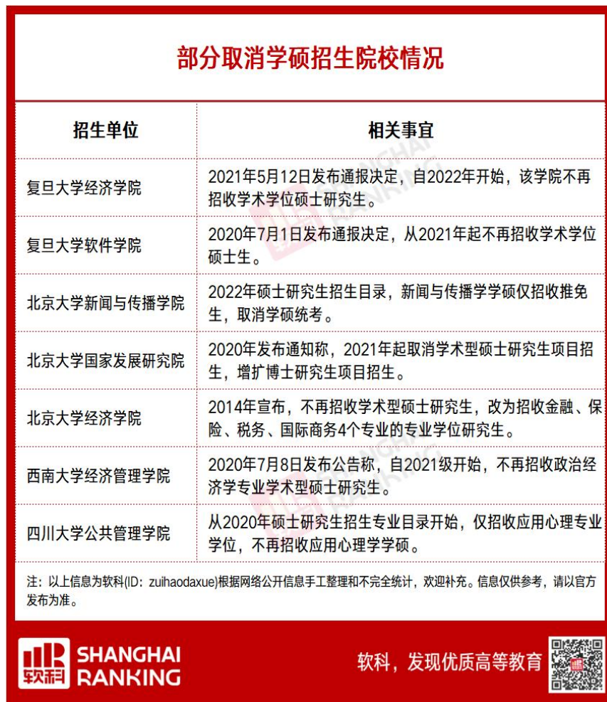
图1 部分取消学硕招生院校情况