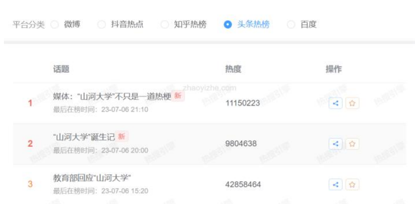
图1 头条热榜有关“山河大学”的话题

整体上，网友对“山河大学”的关注经历了两个爆发期（见图2）：一是“山河大学”一词由诞生到扩散的过程，网友们纷纷以打趣、娱乐的方式参与到“山河大学”的建设讨论中；二是教育部对“山河大学”的回应，引得不同圈层的网友关注到“山河大学”，并对教育部的回应表示赞同。而虚拟高校“山河大学”的走红正如媒体所指出的——“它不仅仅是一个梗”，“山河大学”的讨论折射出考生对教育资源分配问题的困惑，以及新媒体时代青年自我表达的新方式。